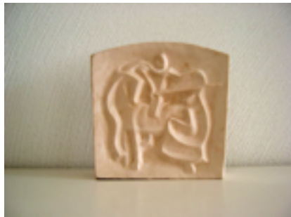
Reliëf van gips 2005.

In 397 stierf Maarten aan koorts. Hij werd op 11 november begraven in de basiliek van Tours.