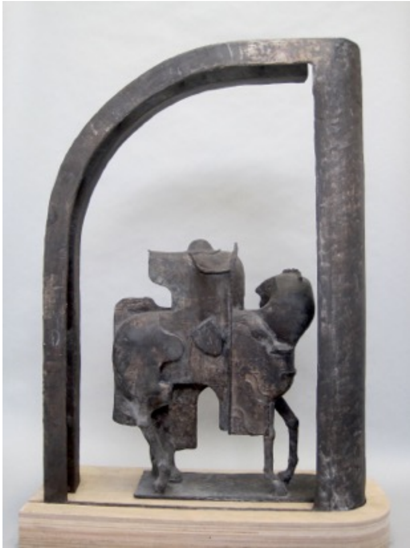
De achterkant van het beeld is als een omslag van een boek. Alles richt zich naar binnen, naar de voorzijde, waar de vertelling plaatsvindt.